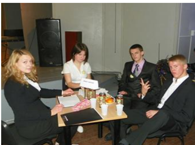
Gimnazijų konkurse atstovavo "PRASMINGO LAIKO PAIEŠKOS KOMANDA - GANA"

31 tašką surinko Ia klasė, 22 taškus – Id klasė, 16 taškų – Ic klasė, 15 taškų – Ie klasė ir 12 taškų Ib klasė.