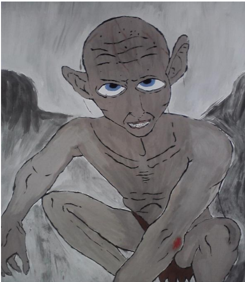
„Golumas“. Piešinio autorė S. Milinauskaitė, I e kl.