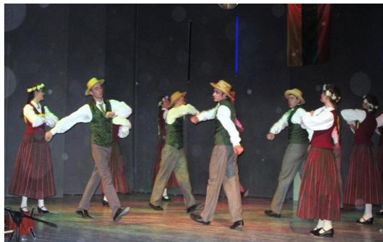
Svečiai iš kaimyninės Latvijos, tai - Ilukstės vidurinės mokyklos tautinių šokių kolektyvas "Ance".

Kovo 9 d. gimnazijos aktų salėje iškilmingai minėjome Lietuvos Nepriklausomybės atkūrimo 22-ąsias metines. Šventiniame koncerte dalyvavo ne tik mūsų gimnazijos skaitovai, dainininkai, skautų draugovė "Gabija", bet ir svečiai iš kaimyninės Latvijos, tai - Ilukstės vidurinės mokyklos tautinių šokių kolektyvas "Ance".