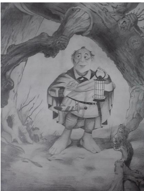
„Hobitas“. Piešinio autorius A.Kulikauskas, 1c