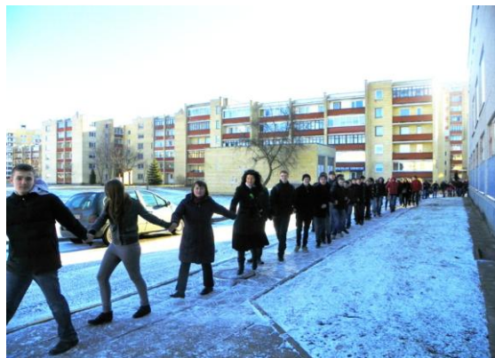
Gimnazija apjuosta gyvuoju mokinių ratu.

Kovo 20 d. - Žemės dienos rytą tradiciškai apjuosę gimnaziją gyvuoju mokinių ratu, pakėlėme Žemės vėliavą. Gimnazijoje diena pražydo mokinių sukurtais žiedais, atsiskleidė gamtos mokslų pamokose ir parodose "Mano augintis", "Būk ekofanas", "Tėvynę aš turiu".