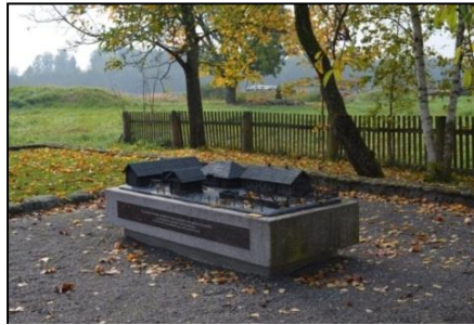
A.Smetonos gimtinės maketas.