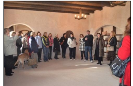
Užugirio krašto muziejus

Šįmet mūsų gimnazijos mokytojai savo profesinę šventę pradėjo švęsti dar jos išvakarėse, aplankydami Utenos rajone esančią A.Smetonos gimtinę, Siesikų pilį ir Taujėnų dvarą.