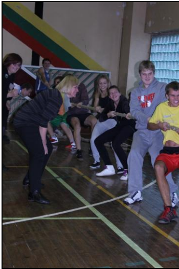
Labiausiai „sirgo“ auklėtojos.