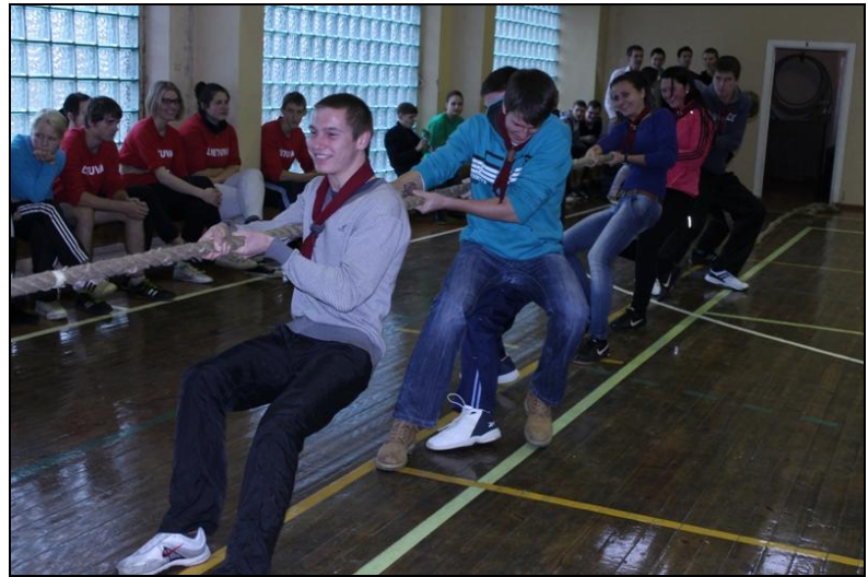
Skautai virvės traukimo rungtyje.

Kita rungtis – 16 kg giros rovimas. Tarpusavyje besivaržantiems vaikinams teisėjavo sunkiosios atletikos treneris K.Čeponis. Giros rovimo rungties iki 65 kg kategorijoje laimėtojai: