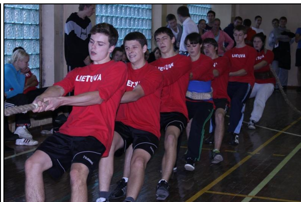
Ramygalos gimnazistai virvės traukimo rungtyje.