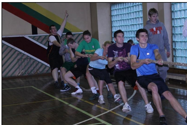
I vietą iškovojo „Minties“ gimnazijos III-IV kl. rinktinė.

Gimnazijų tarpe I vietą iškovojo „Minties“ gimnazijos III-IV kl. rinktinė, II vietą - Ramygalos gimnazijos mokiniai, III vietą - Ila klasė.