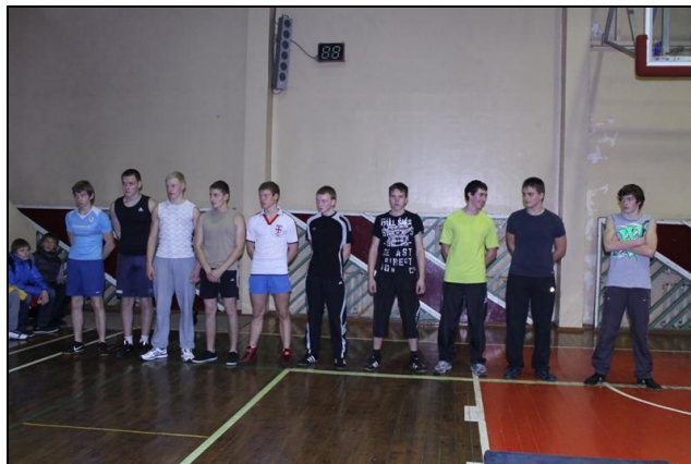
Vaikinai, varžėsi giros rovimo rungtyje.