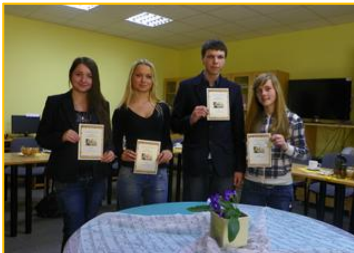
Bibliotekoje apdovanoti geriausi gimnazijos skaitytojai

Pasidomėjome, ką ir kodėl skaito šių dienų gimnazistai, tad keletą jų ir pakalbinome.