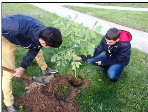
IVb klasės mokiniai sodina ąžuoliuką

Rugsėjo 23-27 dienomis vyko medelių sodinimo akcija. Jos metu kiekviena klasė pasodino po medelį. Taip mūsų mokykla prisijungė prie pasaulinio projekto, kurį organizuoja ENO virtualus mokyklų tinklas. Jungtinių tautų Rio 20 viršūnių susirinkime EKO mokyklos įsipareigojo pasodinti 100 milijonų medžių iki 2017 metų.