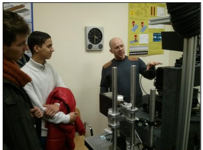
Lietuvos lazerių tyrimo centre.