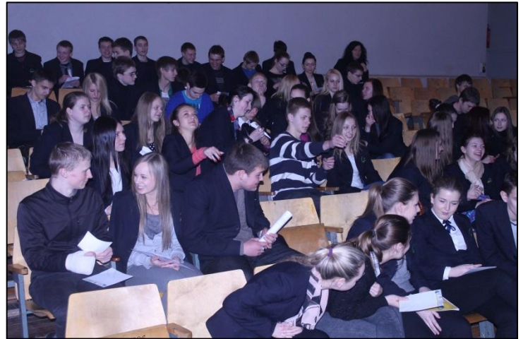
Akimirka iš edukacinio projekto LIFTAS

Mūsų verslo planas buvo įkurti chemijos laboratoriją. Tikėjomės, kad joje gimnazistai mokysis kurti, gaminti, realizuoti natūralias kosmetikos ir higienos priemones, švies mokyklos bendruomenės narius, miesto visuomenę apie higienos ir kosmetikos priemonių teisingą naudojimą, organizuos mokymus, seminarus, o pagamintus produktus realizuos gimnazijoje, kitose miesto mokyklose, mugėse, kosmetikos priemonių prekybos taškuose, salonuose. Gaila, bet į III projekto LIFTAS etapą nepatekome, todėl verslo idėjos realizavimą atidėjome kitiems metams.