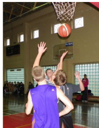
Atkakli kova po krepšiu 3x3 turnyro metu