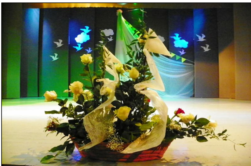
„Šventinė puokštė mokytojams“

Gražiai pradėtą šventę vieni mokytojai pratęsė J. Miltinio dramos teatre, kuriame po iškilmingo minėjimo žiūrėjo latvių režisierės Maros Kimelės spektaklį „Jazminas“, o kiti išvyko į edukacinę kelionę, kurios metu aplankė Krekenavos regioninį parką, Pašilių stumbryną, ilsėjosi kaimo turizmo sodyboje.