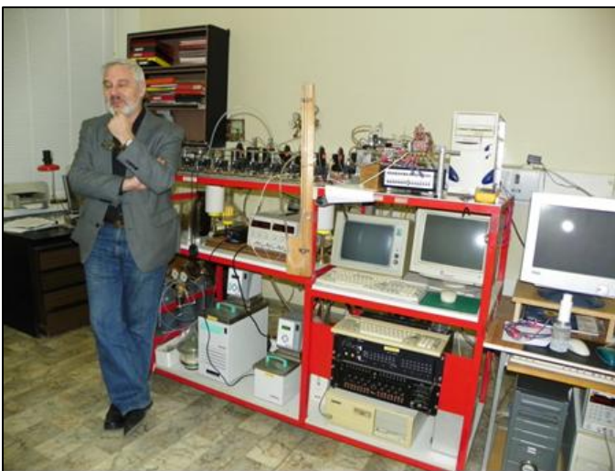
Puslaidininkių fizikos instituto laboratorijoje

Gimnazistai, susipažinę su puslaidininkių bei lazerinių prietaisų panaudojimu, gavę biomedicininę žinių, parengė pristatymus gamtos mokslų pamokose.