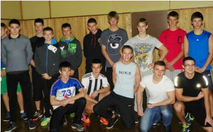
Jėgos varžybų dalyviai.

Sveikiname su artėjančiomis šventėmis, linkime visiems geros nuotaikos, stiprios sveikatos bei sportiškos formos. Iki kitų susitikimų.