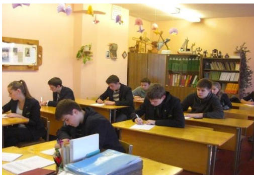
Akimirka iš antroko varžytuvių.

Tradicionis meninio skaitymo konkursas „Versiu knygą neskaitytą“ vyko, paminint nepralenktosios lyrikės – Salomėjos Nėries 110-ąsias metines. Smagu, kad jame dalyvavo daug ketvirtokų, kurie rinkosi įvairių autorių kūrinius – prozą ir poeziją. Dažno lūpose skambėjo S. Nėries nemirtingi eilėraščiai. Pasigedome pirmokų, jie dar labai nedrąsūs – dalyvavo tik viena skaitovė, tačiau pasirodė puikiai, buvo išrinkta tarp kitų šešių laureatų ( trečiokių ir ketvirtokių).Gaila, kad šiais metais ryškiau nesuskambėjo vyriški balsai.