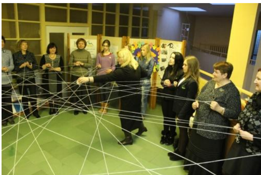
Šventė gimnazijos muziejuje.