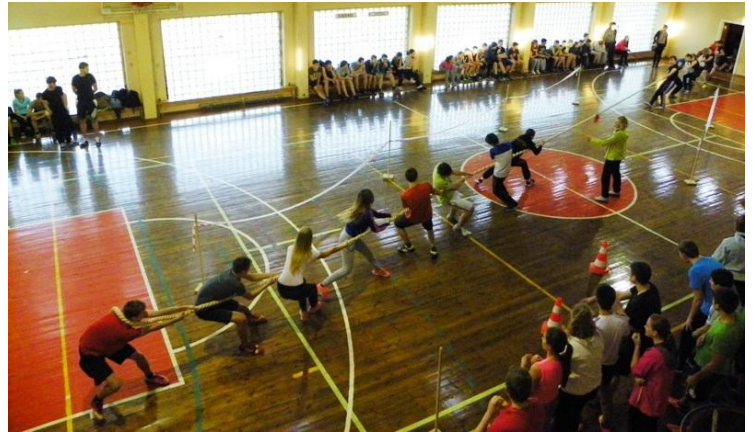
Virvės traukimo varžybos.